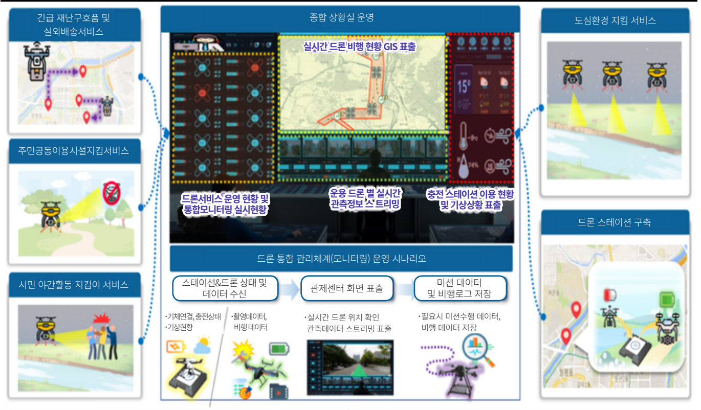
대전 '수호천사' 드론서비스 구축사업 개념도

또한 3대 하천을 따라 지정된 드론특별자유화 구역(이하 드론특구) 내에 시민에게 유용하고 편리한 생활 밀착형 드론서비스인 '수호천사'드론서비스를 제공하고자 하는 사업목표를 갖고 추진 중이며, 계획하고 있는 드론서비스 종류는 크게 네 가지로 ① 긴급재난물품·구호품 등 배송드론, ② 우리동네 지킴드론, ③ 밤길 지킴드론, ④ 도심 환경 지킴드론 등이다.