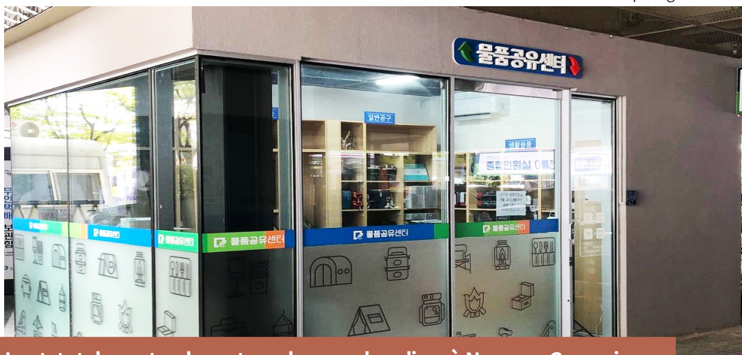
La vue intérieur du centre de partage des biens

Grâce à ces efforts, 95 % des personnes interrogées se sont déclarées « satisfaites » lors de l'enquête de satisfaction menée au second semestre 2021 auprès des résidents. En 2021, le ministère de l'Administration publique et de la Sécurité a également obtenu de bons résultats dans l'évaluation des services d'ouverture et de partage des ressources publiques par les gouvernements locaux. À l'avenir, Nam-gu prévoit d'élargir davantage la compréhension de la culture du partage aux résidents et aux fonctionnaires grâce à des écoles du partage, et d'établir ainsi une culture de partage dans la vie quotidienne.